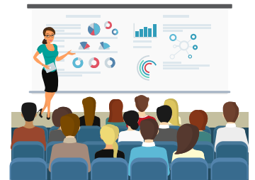
オンラインセミナー への参加