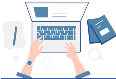
資料のダウンロード・ 情報収集

日本国内・海外どこからでも参加でき、ドイツの大学・研究機関が日本の学生やポスドクのために集結する貴重な機会です（参加無料・要参加登録）。ご参加お待ちしております！